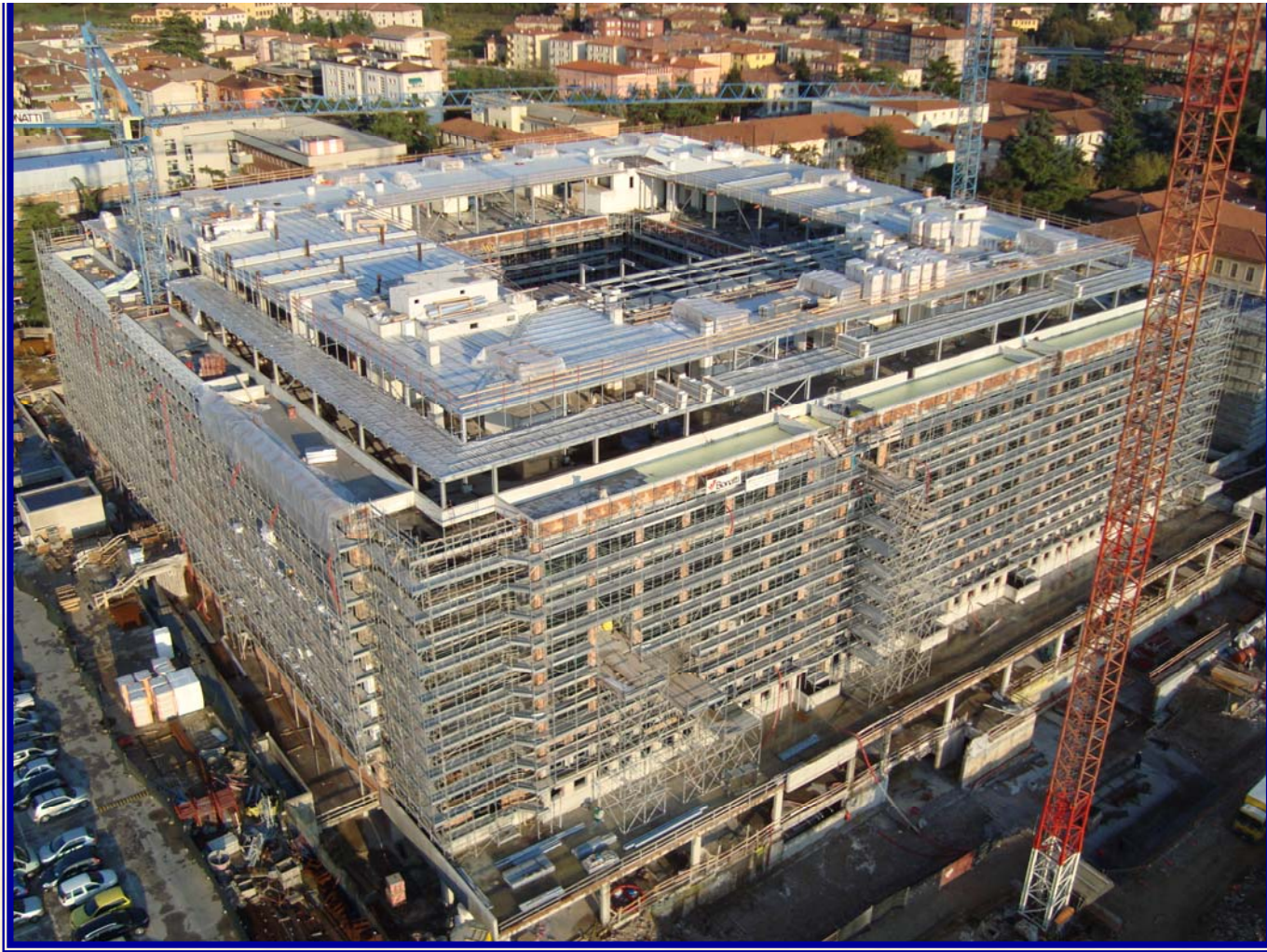
Ospedale Civile Maggiore: POLO CHIRURGICO